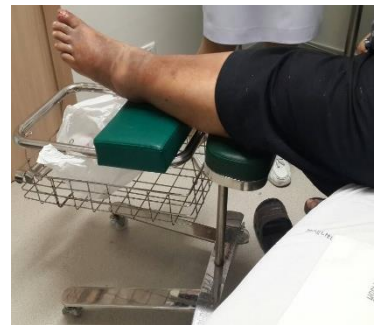
ลักษณะการใช้งาน