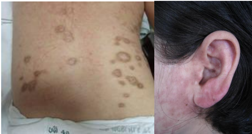
รูปที่ 4 DLE