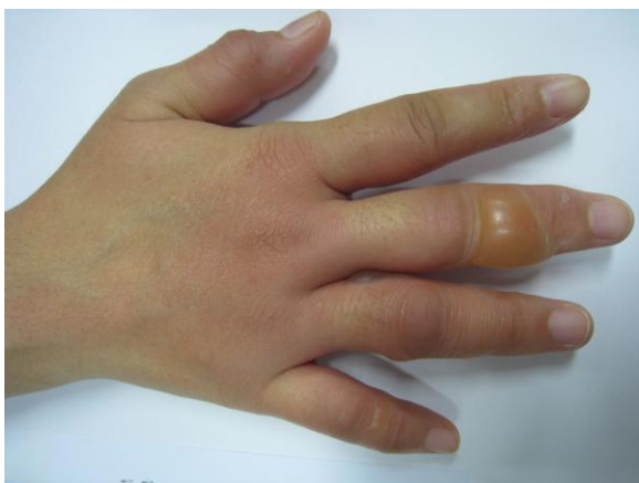
รูปที่ 2 Bullous LE