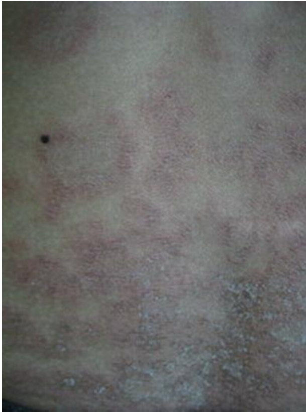
รูปที่ 3 Subacute cutaneous LE (SCLE)