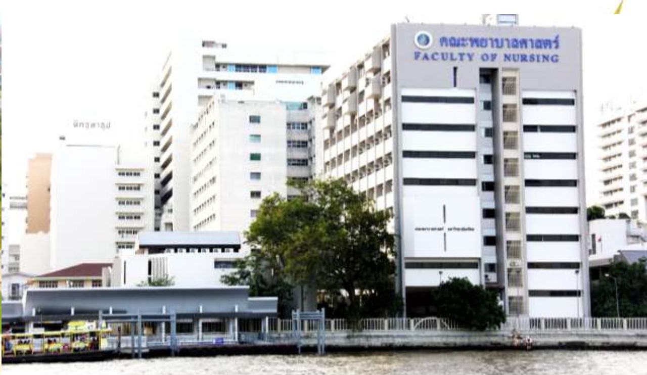
Faculty of Nursing, Bangkoknoi