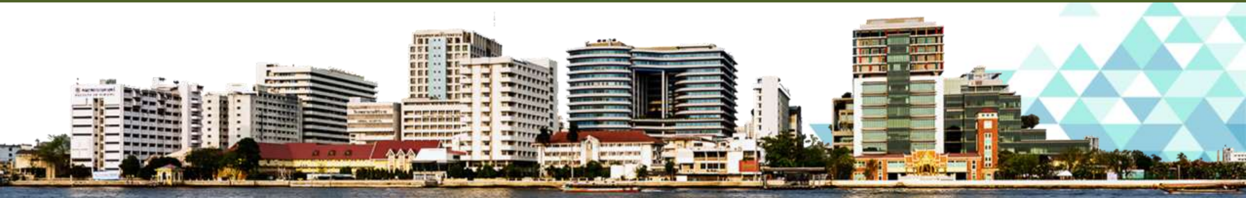
Siriraj Hospital, Faculty of Medicine