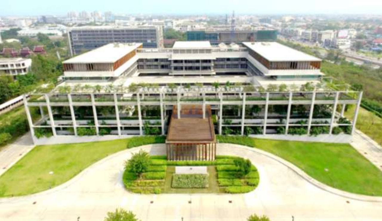
Faculty of Nursing, Salaya