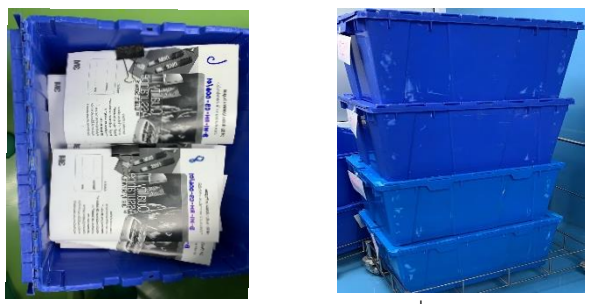
ถังสำหรับจัดเก็บเอกสาร 1 สัปดาห์ จำนวนถังที่ใช้เก็บเอกสาร 1 เดือน