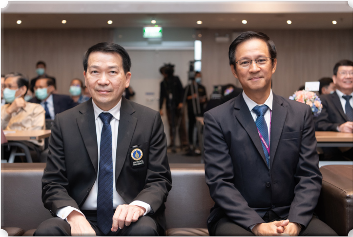
รูปที่ 3 คณบดี คณะแพทยศาสตร์โรงพยาบาลรามาธิบดี และหัวหน้าภาควิชา ศัลยศาสตร์ เข้าร่วมฟังการบรรยาย