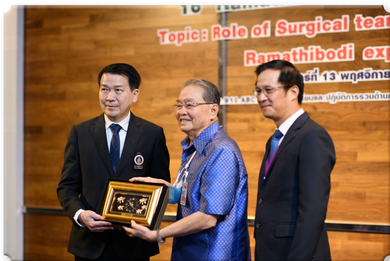
รูปที่ 6 คณบดีฯ และหัวหน้าภาควิชาศัลยศาสตร์ มอบของที่ระลึกให้องค์ปาฐก