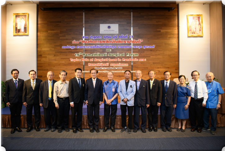
รูปที่ 7 ส่วนหนึ่งของอาจารย์อาวุโสภาควิชาศัลยศาสตร์ ที่มาร่วมงานปาฐกถา เปรม บุรี ครั้งที่ 17