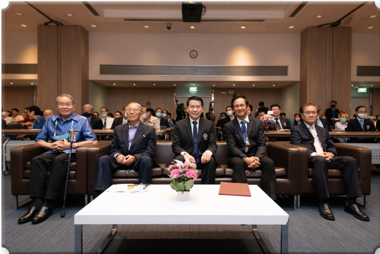
รูปที่ 4 องค์ปาฐก อาจารย์อาวุโสภาควิชาศัลยศาสตร์ คณบดีฯ และหัวหน้าภาควิชา ศัลยศาสตร์ ถ่ายภาพที่ระลึก