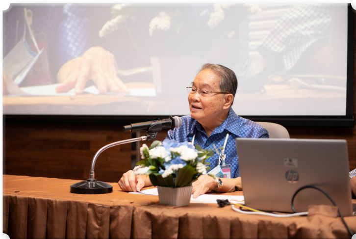
รูปที่ 5 ศาสตราจารย์คลินิกเกียรติคุณ นายแพทย์วรารุณ สุขมาวงศ์ องค์ปาฐก ในงาน ปาฐกถา เปรม บุรี ครั้งที่ 17