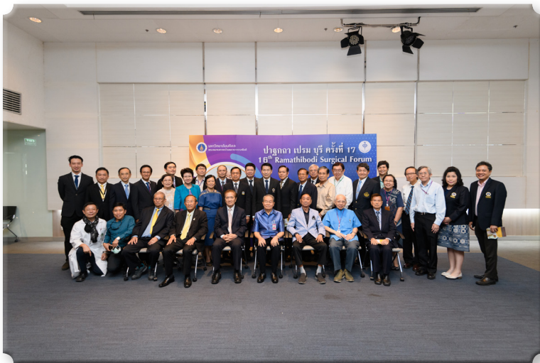
รูปที่ 8 อาจารย์ประจำ และอาจารย์อาวุโส ของภาควิชาศัลยศาสตร์ ถ่ายภาพที่ระลึก ร่วมกัน